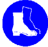
Obvezna uporaba zaščitnih škornjev