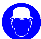
Obvezna uporaba varnostne čelade