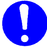
Splošen znak za obveznost (biti mora dopolnjen z drugim znakom)