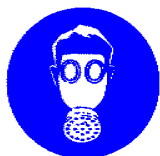
Obvezna uporaba respiratorja