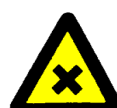
Škodljiva in dražeča snov