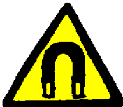
Močno magnetno polje