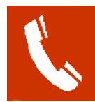
Telefon za javljanje požara