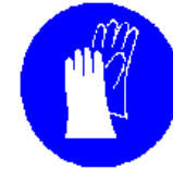
Obvezna uporaba zaščitnih rokavic