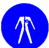
Obvezna uporaba zaščitnega kombinezona