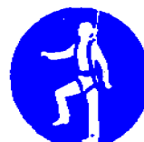
Obvezna uporaba varnostnega pasu