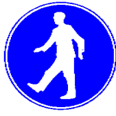
Obvezna pot za pešce