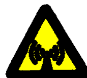
Neionizirajoče sevanje !