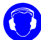
Obvezna uporaba zaščite ušes