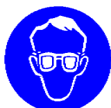
Obvezna zaščita oči

– bel piktogram na plavi podlagi (plava barva mora zavzemati najmanj 50 % površine znaka).