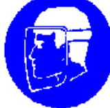
Obvezna uporaba ščitnika obraza