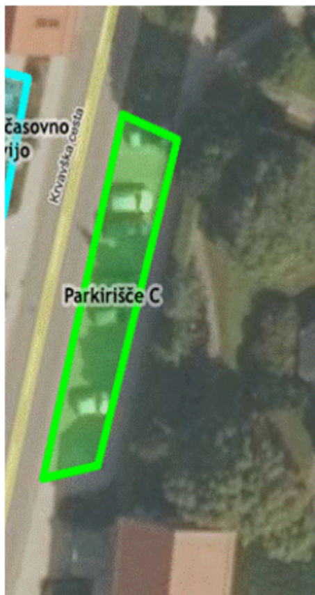
Priloga 2: lokacije javnih parkirnih površin s časovno omejitvijo pri OŠ Davorina Jenka, na označenih mestih